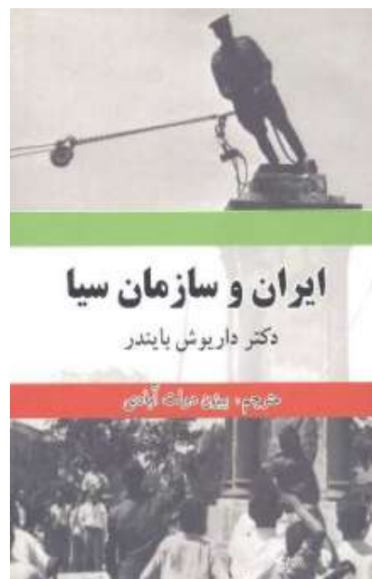
شرکت کتاب لس آنجلس مترجم بیژن دولت آبادی